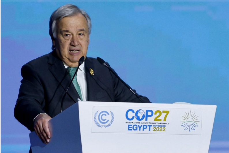
M. Antonio Guterres Chef de l'ONU

“Nous sommes en route vers l'enfer climatique avec le pied sur l'accélérateur”